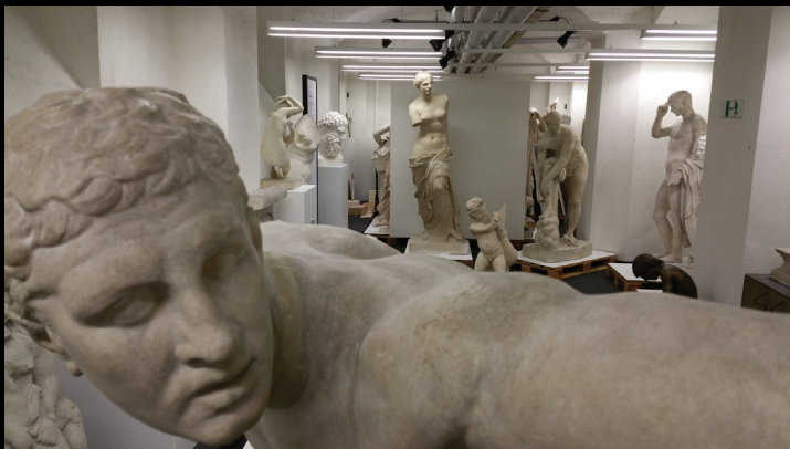
Table Ronde 2016 SAKA-ASAC Les collections de l'Antiquité classique en Suisse

Inscription jusqu'au 7 novembre 2016: info@saka-asac.ch