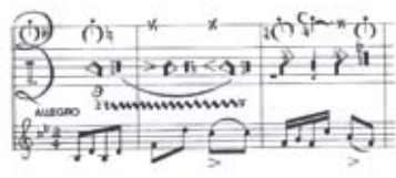
Photo: La Sténochorégraphie, où l'art d'écrire promptement la danse / Arthur Saint-Léon, 1852

Lors de cette journée d'étude, la notation sera d'abord examinée sous l'angle épistémologique, puis dans deux déclinaisons voisines bien que différentes: la notation musicale et la notation de la danse. Cette approche pluridisciplinaire de la notation permettra de réfléchir aux possibilités (ou impossibilités) de rendre compte d'une séquence temporelle d'évènements dans un support graphique correspondant à un code établi. Elle favorisera la comparaison des processus d'écritures et de lectures propres aux deux domaines approchés (musique et danse). Nous gageons qu'elle générera un dialogue enrichissant et de nouvelles réflexions, tant pour les chercheurs que pour les étudiants et les auditeurs présents.