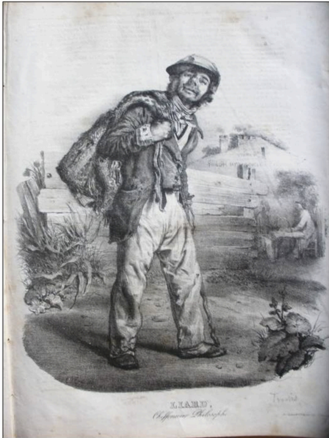
LIARD, Chiffonier Philadelph.