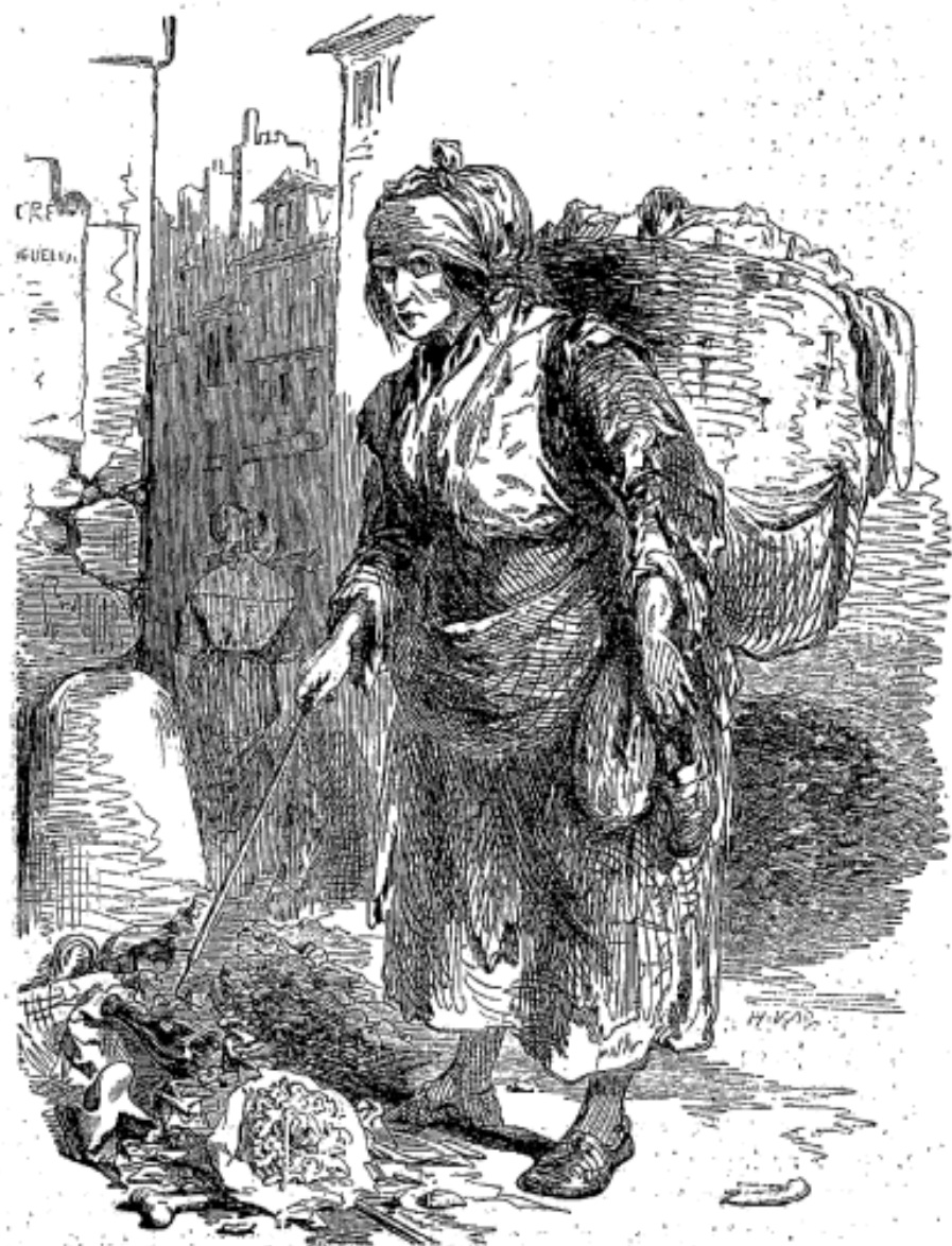
Le bouquet du lendemain.