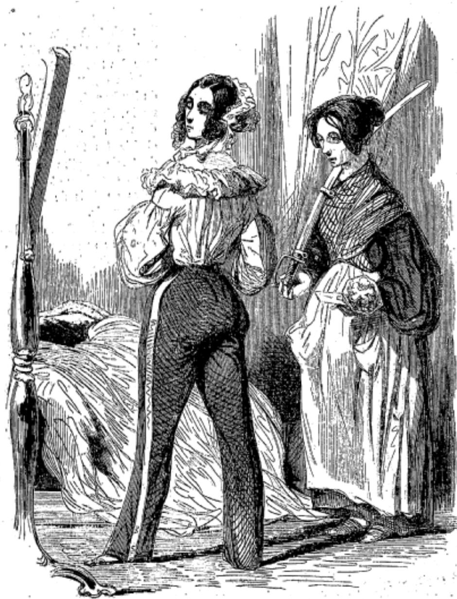
Le bouquet de la veille.