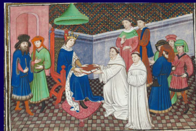
Bruxelles, KBR, ms. 9474, f.1r.

Université de Genève Faculté des Lettres Uni Mail, Salle M1193 Bd du Pont-d'Arve 40 1205 Genève