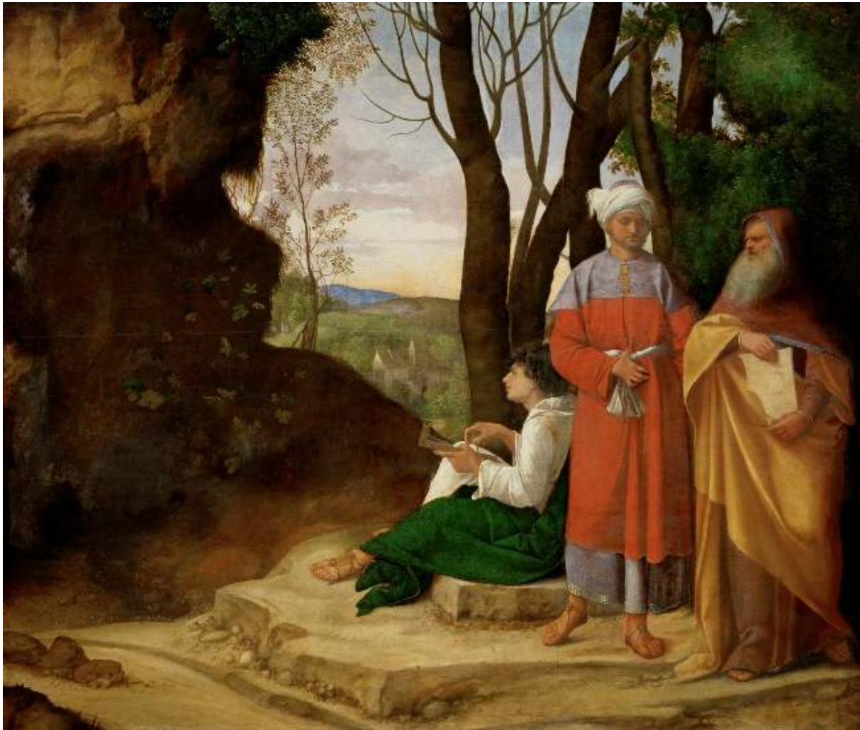
Les trois philosophes Giorgione (1477/1478-1510) Huile sur toile - 123 x 144 cm Vienne, Kunsthistorisches Museum