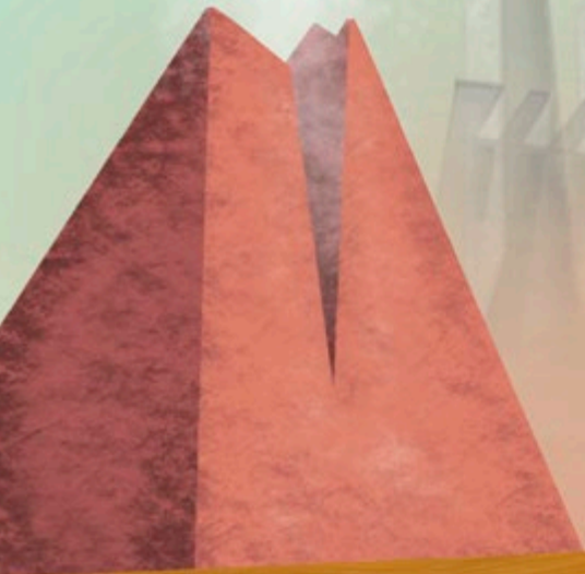
Illustration: Valentina Turchetti @valentina.turchetti_art