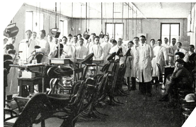
Salle clinique dans les années 1930. La blouse blanche a remplacé le costume-cravate

Au fil de l'évolution clinique et technique de la profession, le corps professoral s'étoffe et se diversifie. Ainsi, chaque nouveau professeur est responsable d'un domaine spécifique de la santé bucco-dentaire.