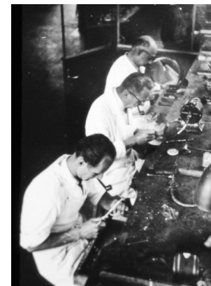
Les machines n'étaient pas les seules à fumer !

Entre 1932 et 1975, plusieurs remaniements ont lieu en fonction de l'évolution des pratiques cliniques et techniques, ainsi que des progrès de la recherche. De nouvelles chaires sont créées - traitements conservateurs, orthodontie, prothèse conjointe ou fixe et policlinique - ainsi qu'un enseignement spécialisé en radiologie dentaire, qui auparavant était assuré par les radiologues de la Faculté de médecine. En 1941, nouvelle évolution: un remaniement de la Loi sur l'Instruction publique rattache l'Institut dentaire de l'Université à la Faculté de médecine, renommé pour l'occasion Institut de médecine dentaire.