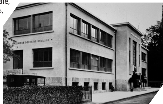
La Clinique dentaire scolaire occupe une partie du 1 er étage de l'aile gauche

Dans ses nouveaux locaux, l'Institut dentaire de l'Université peut enfin se développer. Ses professeurs se spécialisent dans de nombreux domaines, notamment: clinique dentaire, policlinique dentaire et orthodontie, prothèse générale et chirurgicale, couronnes et appareils à ponts, stomatologie clinique ou encore pharmacologie. Des professeurs de la Faculté de médecine assurent quant à eux les enseignements en stomatologie normale, anatomie pathologique de la cavité buccale et chirurgie générale appliquée à l'art dentaire.