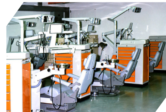
Trois fauteuils de soins - 1980

En 2014, dernière mutation. La Section de médecine dentaire change une fois encore de dénomination pour devenir la Clinique universitaire de médecine dentaire (CUMD); elle met ainsi l'accent sur son activité de soins et son insertion au cœur de la Cité. Sous sa nouvelle structure, la CUMD comporte la Consultation de programmation, le Département de médecine dentaire préventive et de premier recours (avec les divisions de cario-logie et d'endodontie, de parodontologie et une Unité d'action sociale) et le Département de réhabilitation oro-faciale (avec les divisions d'orthodontie, de prothèse fixe et biomatériaux, de gérodontologie et prothèse adjointe, l'unité de radiologie intraorale et le laboratoire odontotechnique). Avec le transfert de la stomatologie aux HUG, deux unités sont créées au sein du Service de chirurgie maxillo-faciale (l'une de chirurgie orale et implantologie, l'autre de médecine et pathologie orale et maxillo-faciale). Ce service, rattaché au Département de chirurgie des HUG, est affilié à la CUMD. C'est le début d'une fructueuse collaboration interinstitutionnelle en matière de médecine dentaire.