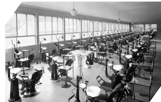
Grande salle clinique

Entre 1932 et 1975, plusieurs remaniements ont lieu en fonction de l'évolution des pratiques cliniques et techniques, ainsi que des progrès de la recherche. De nouvelles chaires sont créées - traitements conservateurs, orthodontie, prothèse conjointe ou fixe et policlinique - ainsi qu'un enseignement spécialisé en radiologie dentaire, qui auparavant était assuré par les radiologues de la Faculté de médecine. En 1941, nouvelle évolution: un remaniement de la Loi sur l'Instruction publique rattache l'Institut dentaire de l'Université à la Faculté de médecine, renommé pour l'occasion Institut de médecine dentaire.