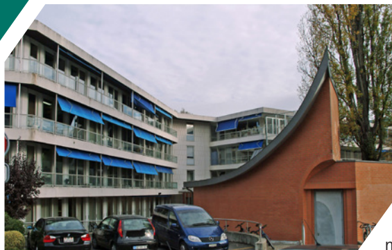
La Section de médecine dentaire, ses salles de cours et sa cafétéria

1975: nouveau changement de nom et d'adresse pour la médecine dentaire. L'Institut devient la Section de médecine dentaire et prend ses quartiers rue Barthélemy-Menn, à côté de la Clinique de pédiatrie des HUG. Ce déménagement devait être provisoire, le temps pour le Centre médical universitaire de terminer son installation sur la colline de Champel. Ce chantier en six étapes devait se conclure dans les années 1980; il ne le sera que 36 ans plus tard. Dans l'intervalle, la Section de médecine dentaire poursuit son développement dans ses trois domaines d'expertise que sont les soins, l'enseignement et la recherche. A l'instar des autres sections de la Faculté de médecine, la médecine dentaire est désormais structurée en départements avec des divisions: le