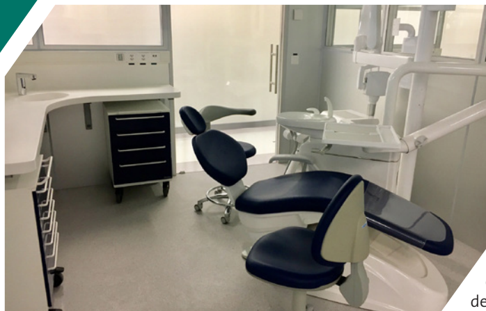
Nouveau fauteuil dans son box individuel vitré