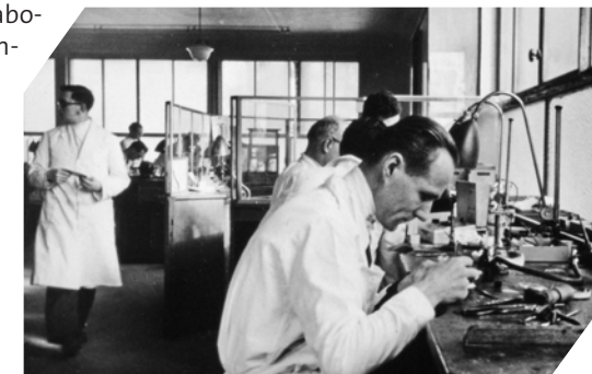
Laboratoire odontotechnique (à l'arrière-plan, la cage vitrée du technicien-chef où sont stockées les réserves d'or)