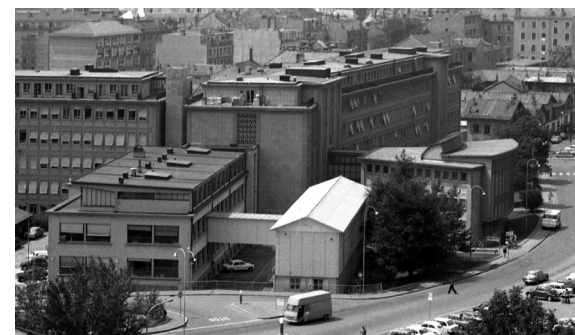
L'Institut de médecine dentaire (amputé d'une partie de son aile ouest par l'imposant bâtiment des Policliniques) après sa surélévation et la construction de l'annexe (fin des années 1960)