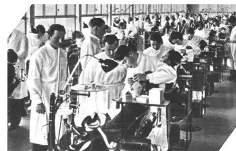
Grande salle clinique en pleine activité