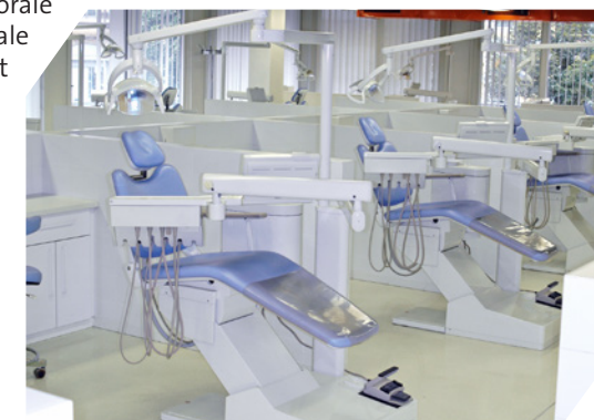
Années 2000: salle clinique après rénovation et installation de cloisons ménageant pour les patients une relative intimité