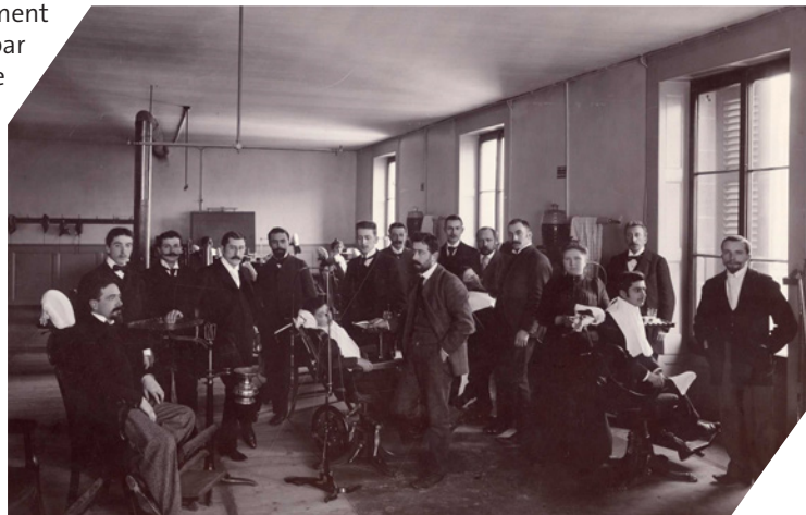
Salle clinique aux environs de 1900

Le diplôme de «médecin-chirurgien-dentiste» est décerné à la fin du curriculum (soit six semestres d'étude), pour autant que l'examen final - régi dès 1888 par un règlement fédéral - soit réussi. La profession prend par la suite le titre de «médecin-dentiste», titre encore en vigueur à l'heure actuelle. Le nombre de diplômés, genevois, confédérés et étrangers, passe d'une vingtaine pour la première volée à près d'une soixantaine en 1932, lors du déménagement de l'Ecole à la Rue Micheli-du-Crest. A cette époque, près de deux mille patients bénéficient chaque année de soins prodigués par les professeurs et les étudiants de l'Ecole. Le modèle de formation axé sur l'alternance de la théorie et de la pratique, adopté dès la fin du XIX e siècle, constitue encore aujourd'hui la force du modèle d'enseignement de la médecine dentaire genevoise.