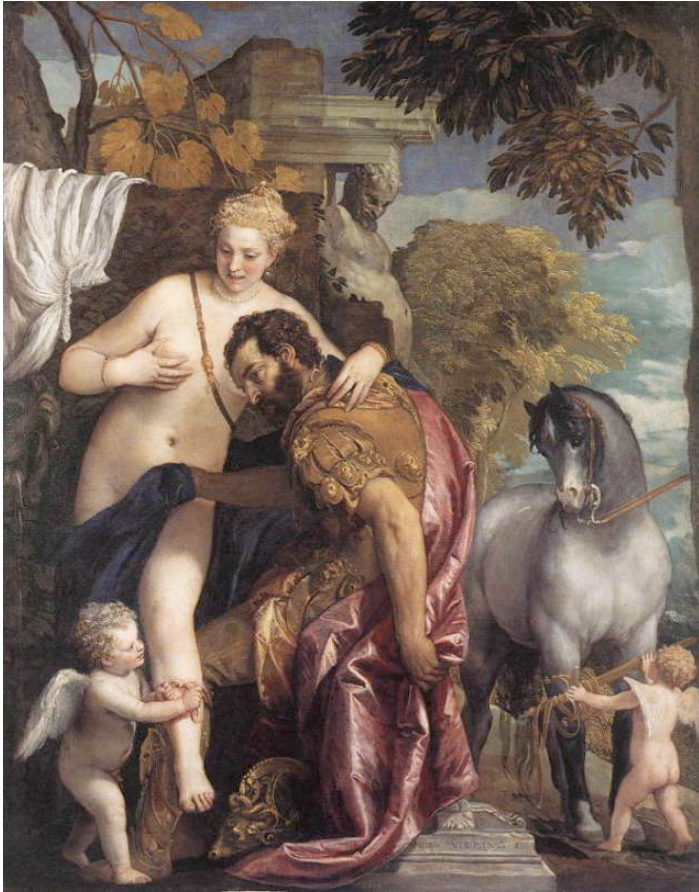
Fig. 6 : P. Véronèse, L'Enlèvement d'Europe , 1580, Palazzo Ducale, Venise

Les deux best-sellers présentés montrent à l'œuvre deux modes de construction et de légitimation de l'altérité par la géographie : le déterminisme néodarwiniste et la fiction géographique (et sa réification). Il est de la responsabilité des géographes de déconstruire ces discours, savants ou vernaculaires, qui font usage de la discipline. Cela suppose de connaître l'histoire de la discipline, à laquelle ces arguments sont souvent empruntés, et de l'assumer dans un travail de mémoire critique. Cela suppose aussi d'oser le débat avec les sciences dures, débat sans doute difficile car les sciences dures s'y sont engagées avant nous, et avec une légitimité scientifique et sociale supérieure à la nôtre.