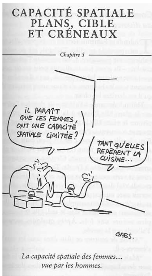
Fig. 4 : Pease, 2000 : 177

Cette histoire de la différenciation des sexes met en avant des causes géographiques. Ce nouveau mythe de la caverne explique en termes d'histoire naturelle la construction d'une différence entre les hommes et les femmes, qui tient fondamentalement à leur affectation à deux espaces différents : à la femme, l'intérieur de la caverne et les vertus domestiques ; à l'homme, l'extérieur et la maîtrise de la nature. Les hommes et les femmes sont différents par nature parce qu'ils relèvent par nature de deux espaces naturellement différents ; aussi les dissemblances entre les hommes et les femmes tiennent pour beaucoup à leurs capacités et comportements spatiaux (« la capacité spatiale étant un des attributs masculins les plus forts » [Pease, 2001 : 258]). Ainsi, l'ouvrage dédie un chapitre spécifique à la capacité spatiale (fig. 4)