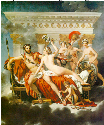
Fig. 1 : J. David, Mars désarmé par Vénus et les trois Grâces , 1824, Musées royaux des beaux-Arts, Bruxelles

Vénus, la planète d'où viennent les femmes, a été baptisée du nom de la déesse de l'amour ; Mars, celle des hommes, du dieu de la guerre. La toponymie sidérale, par sa référence à la mythologie romaine, attribue bien à chaque planète un sexe et une série de caractères qui sont ceux du dieu éponyme et ceux que la civilisation occidentale attribue aux genres masculin et féminin (fig. 1). Les symboles astrologiques des deux planètes sont d'ailleurs ceux par lesquels les biologistes figurent les sexes masculins et féminins.