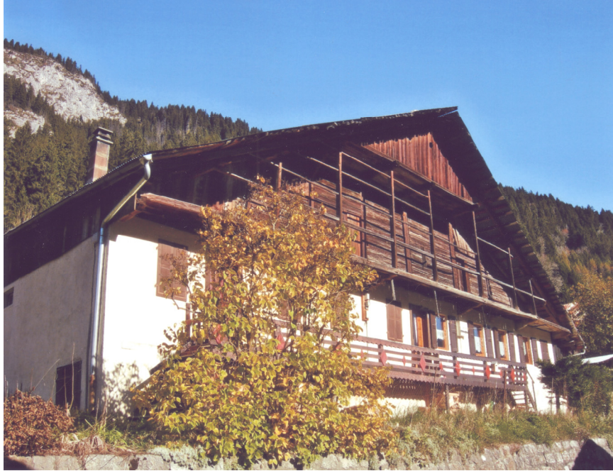
Chalet typique du Val d'Abondance. L'élévation principale est en pierre sur deux niveaux. Au-delà, les poteaux soutiennent les sablières. Le troisième niveau est constitué d'un assemblage de madriers équarris. Il abrite le fenil. Sortie du 13 juin 2009.