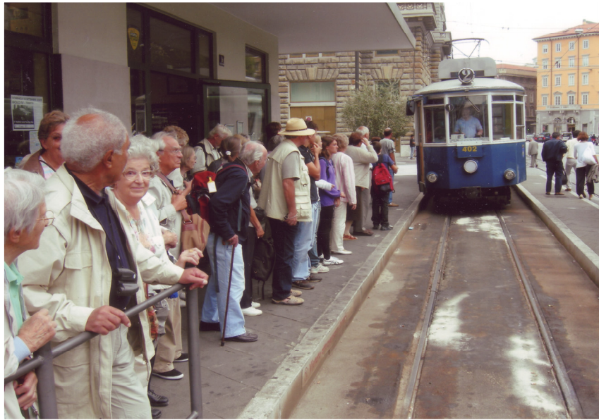
Lors du voyage au Nord de l'Adriatique et à Trieste, les participants attendent patiemment le tram historique de Trieste à Villa Opicina. Voyage du 10 au 13 septembre 2009. (photo René Zwahlen).