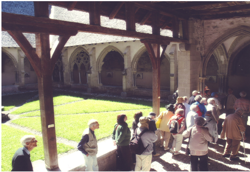
L'abbaye augustinienne d'Abondance possédait au Moyen Age toute la vallée du même nom. Le cloître, édifié au XIV e siècle, a conservé deux galeries gothiques et de très belles fresques du XV e d'influence italienne. Sortie du 13 juin 2009. (photo Christian Moser).