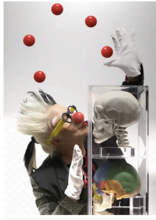
Red rose and mockery of death. Photography, ORLAN's skull in 3D painting, 16,4