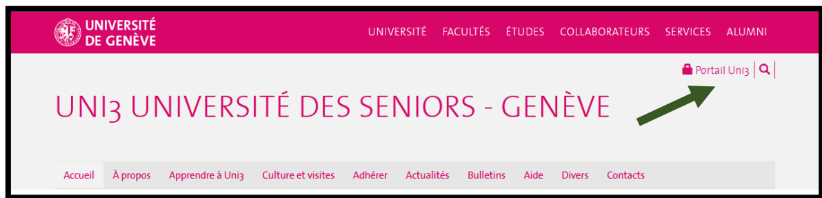
Image 2: Le lien de connexion au Portail Uni3 est toujours disponible à cet emplacement

Cliquez sur ce lien pour ouvrir le Portail.